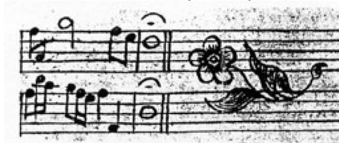
Petit dessin (arabesque-ornement) de la main de Bach sur la partition.

Le figuier ne porte pas de fleur. Celle-ci se développe à l'intérieur du fruit. La figue contient la fleur infinie de son poème. La fugue, elle, engendrée par une seule phrase musicale, fleurit, s'ornemente, et toujours, se poursuit .